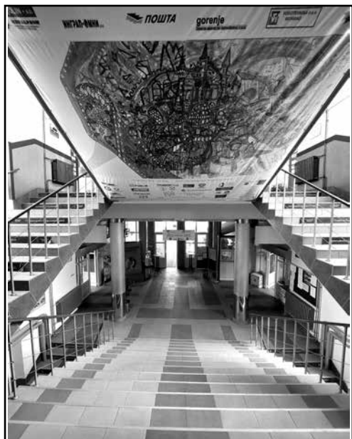
Главни хол школе (лево) Наш музеј (голе)