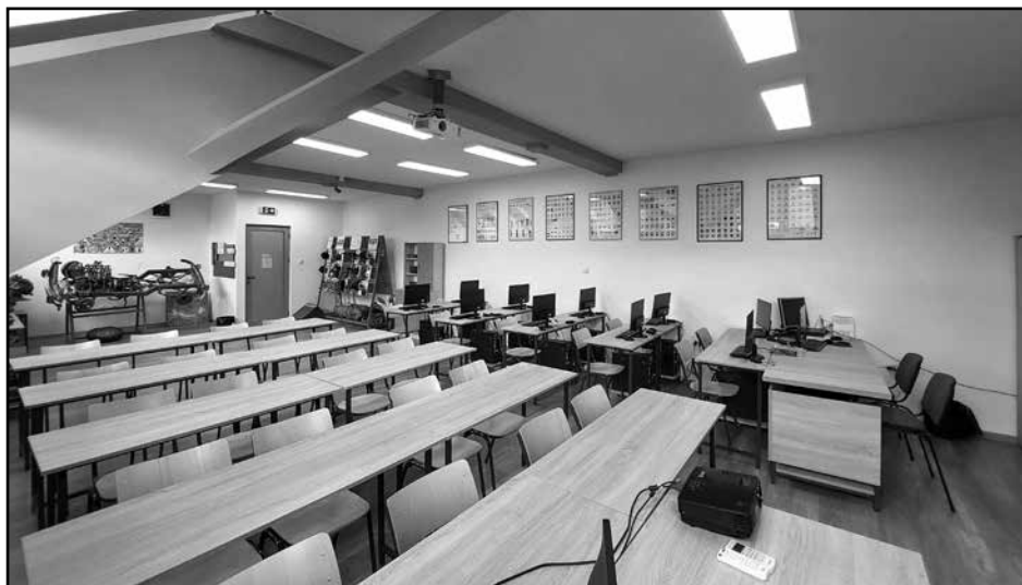
Кабинети за саобраћај, логистику и транспорт

Техничар друмског саобраћаја - Овај образовни профил омогућава ученицима да стекну теоријска и практична знања о организацији и превозу путника и робе, о безбедности и регулисању саобраћаја, о саобраћајној инфраструктури, моторима и моторним возилима, као и многе детаље везане за друмски саобраћај.