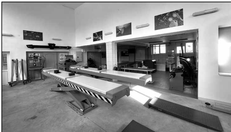
Ауто сервис /механика и дијагностика/