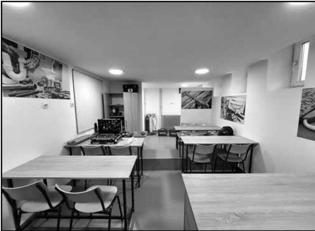
Радионица за инсталацију водовода, грејања и клима уређаја

Инсталатер водовода, грејања и клима уређаја поставља водоводне, канализационе, грејне и инсталације комфорних клима уређаја, који стварају температурне услове за боравак људи, и припадајуће елементе система према пројектној документацији у зградама.