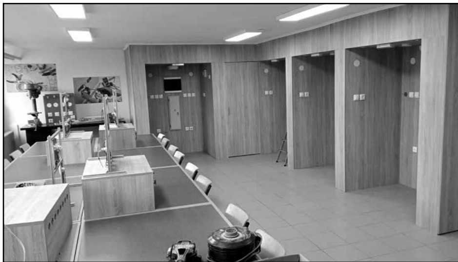
Радионица за електричне инсталације