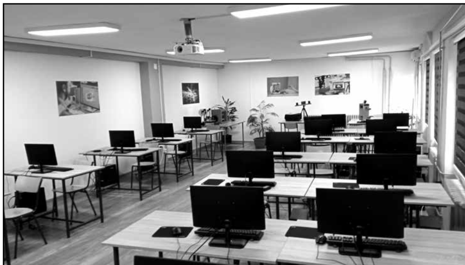
Моделирање и 3D штампа (горе) Технолошки системи (доле)