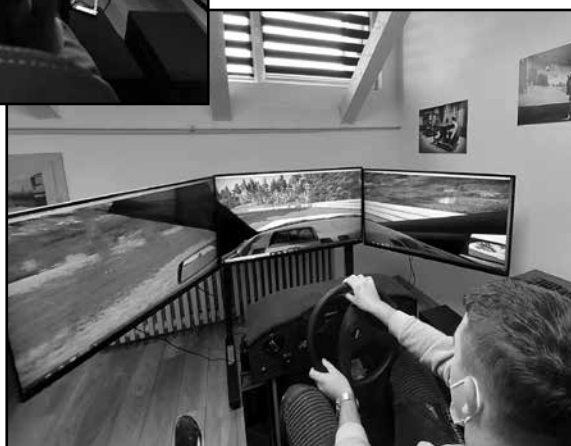
Дидактички симулајор сијурне вожње