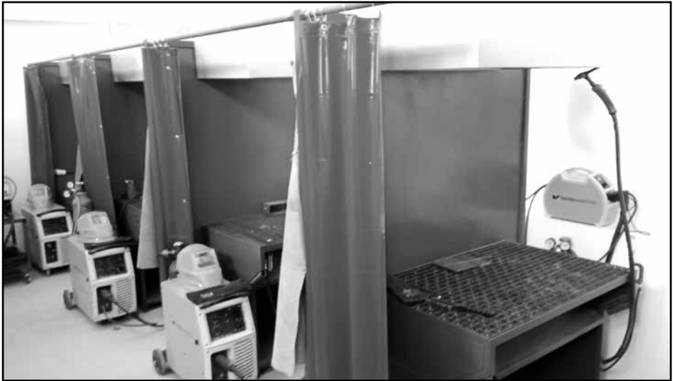
Радионица - Бравар - заваривач

По завршетку образовања за образовни профил бравар-заваривач , ученик ће стећи следеће стручне компетенције: