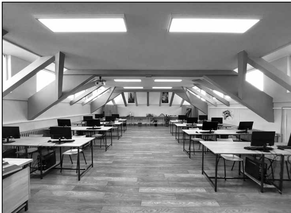
Кабинет за грађевину и архитектуру

Ко жели да се даље школује стећи ће потребна предзнања за упис на факултете за архитектуру и грађевину, али и на остале техничке факултете или високе школе.